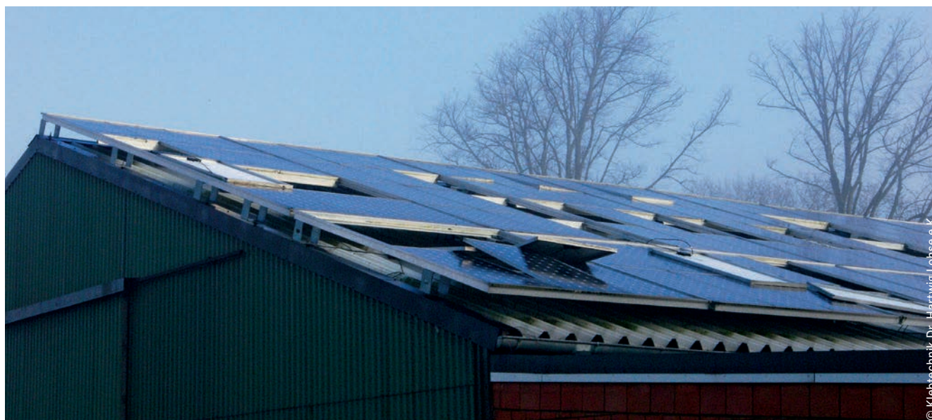
Bild 1: Reihenweises Versagen der Klebverbindungen nach hoher Windbelastung zwischen Solar-Modulen und Aluminium-Unterkonstruktion infolge gravierender Klebfehler

häufig Klebungen nicht die an sie gestellten Anforderungen erfüllen und es im Gebrauch zu Ausfällen kommt. Objektiv betrachtet beruhen etwa 90 % der auftretenden Klebfehler auf klebtechnischer Unkenntnis. Dieser objektiven Tatsache steht gegenüber, dass der Anwender in seiner subjektiven Wahrnehmung natürlich alles richtig gemacht hat (Wer macht schon bewusst Fehler?) und daher ebenso automatisch wie fälsch-