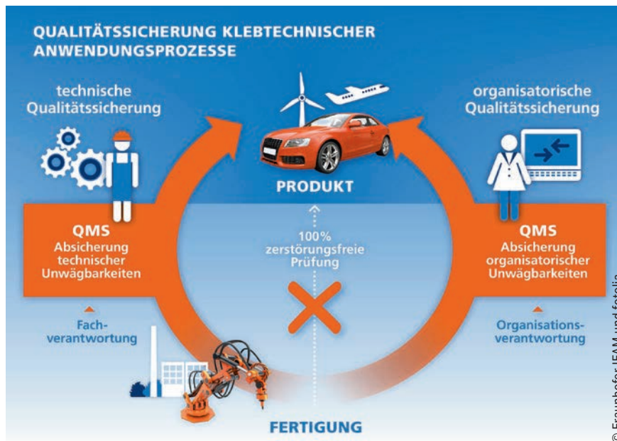
Bild 4: ISO 9001 - technische und organisatorische Qualitätssicherung als „Umweg“ zur Sicherstellung der Produktqualität bei speziellen Prozessen, weil Qualität nicht zu 100 % zerstörungsfrei prüfbar ist